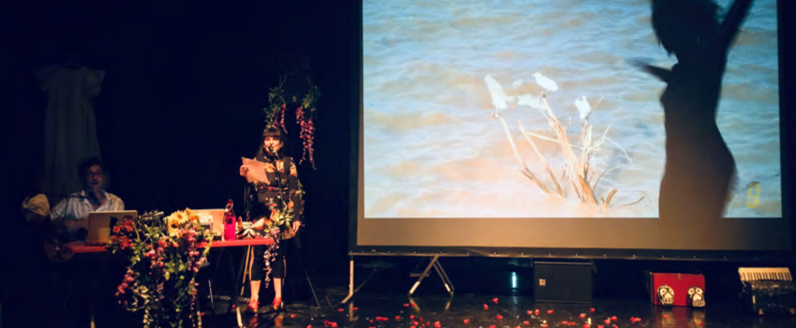
Photo de répétitions au Pôle Nord 2019