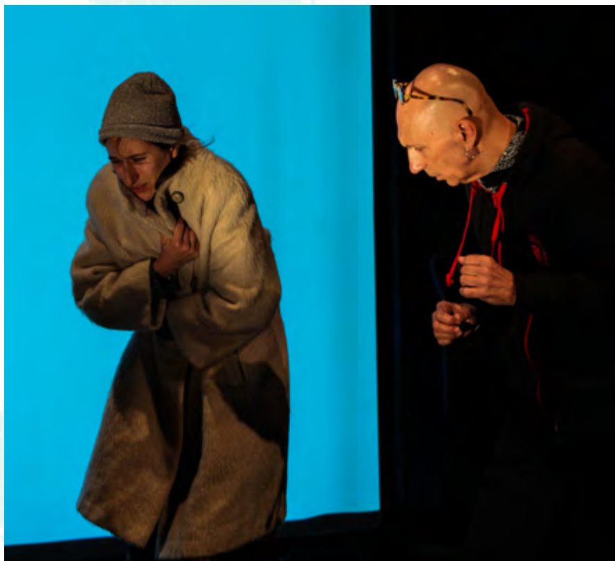
Répétition de la marche contre le vent avec le metteur en scène