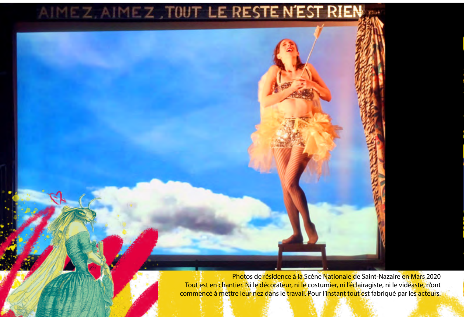
Photos de résidence à la Scène Nationale de Saint-Nazaire en Mars 2020 Tout est en chantier. Ni le décorateur, ni le costumier, ni l'éclairagiste, ni le vidéaste, n'ont commencé à mettre leur nez dans le travail. Pour l'instant tout est fabriqué par les acteurs.

« L'Âne et le Chien », Livre VIII, Fable 17 »