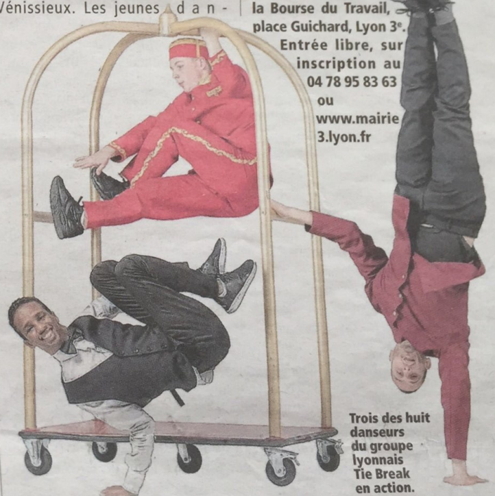
Trois des huit danseurs du groupe lyonnais Tie Break en action.

Entrée libre, sur inscription au 04 78 95 83 63 ou www.mairie3.lyon.fr